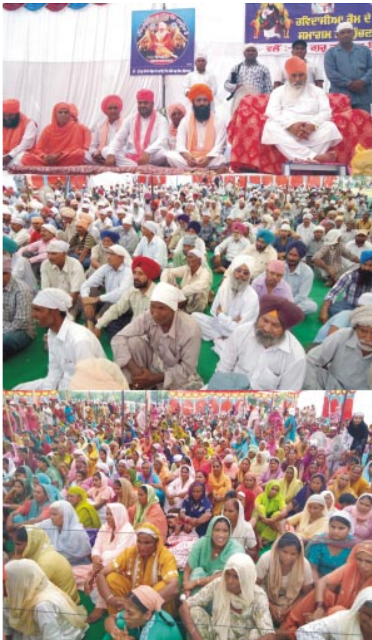
(ਸਫਾ 1 ਦੀ ਬਾਕੀ)